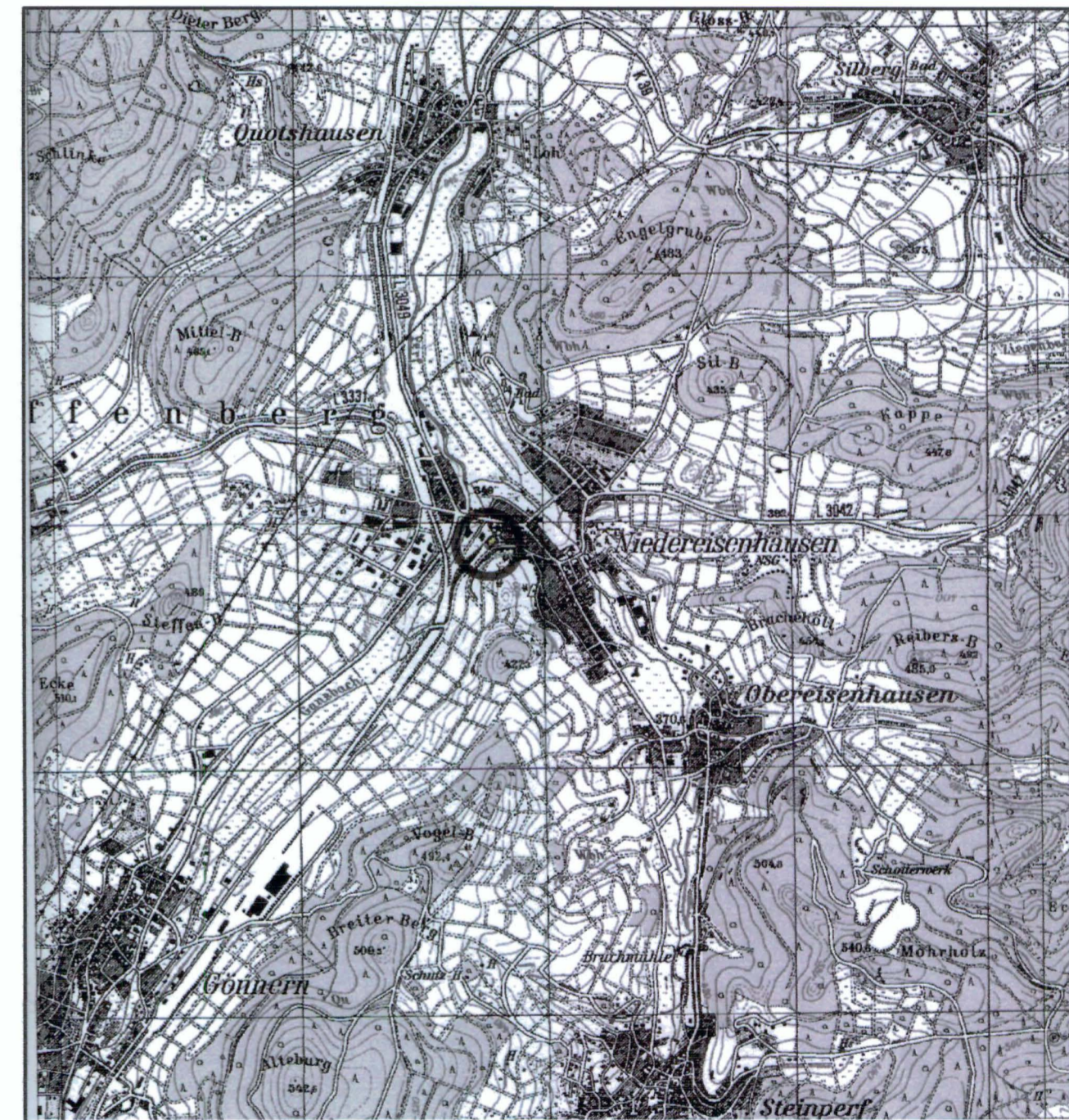
Übersichtskarte (Maßstab 1 : 25.000)