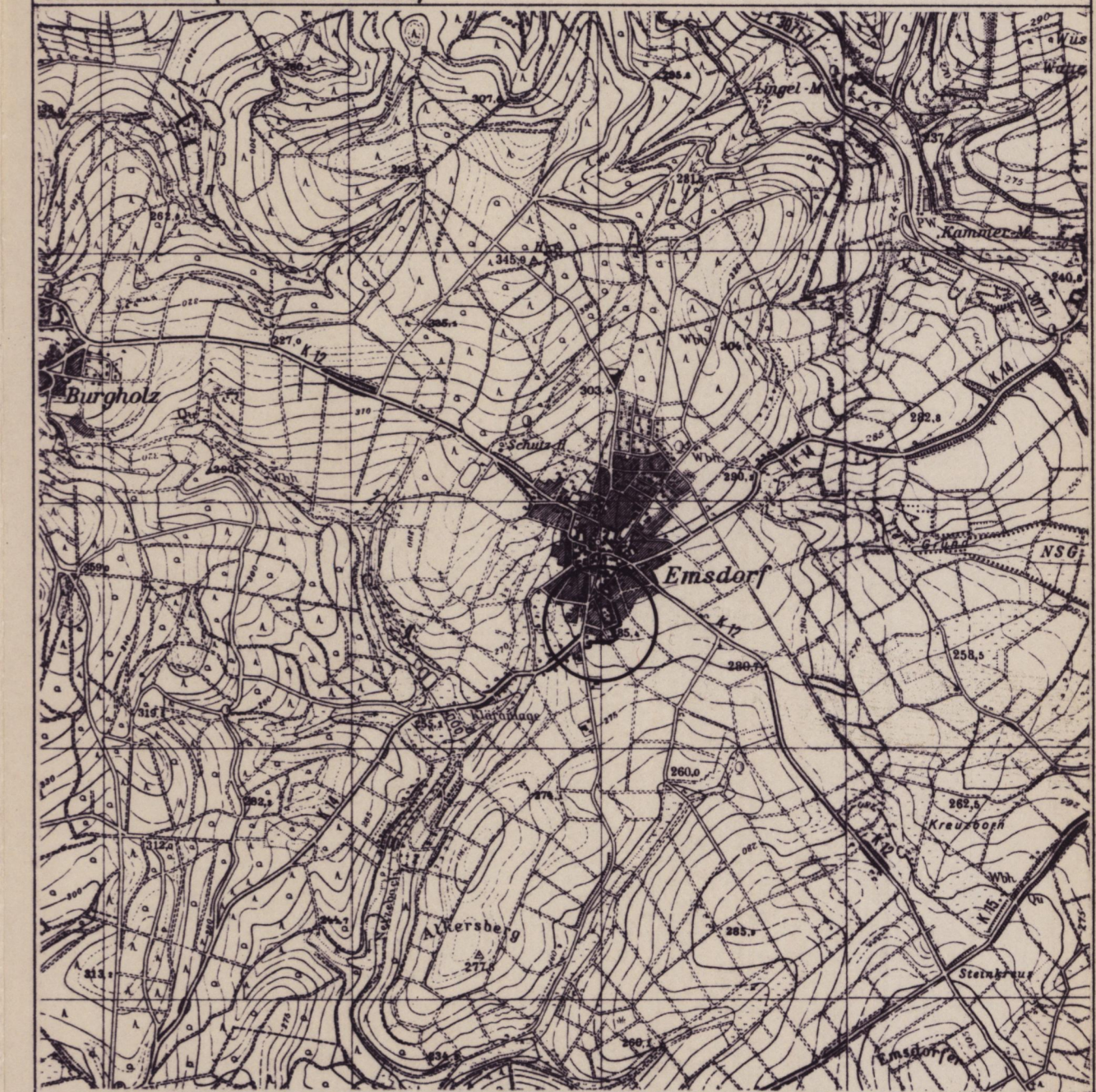
Übersichtskarte (Maßstab 1 : 25.000)

Stadt Kirchhain, Stadtteil Emsdorf Satzung nach § 34 Abs. 4 Nr. 1 BauGB Magistrat der Stadt Kirchhain