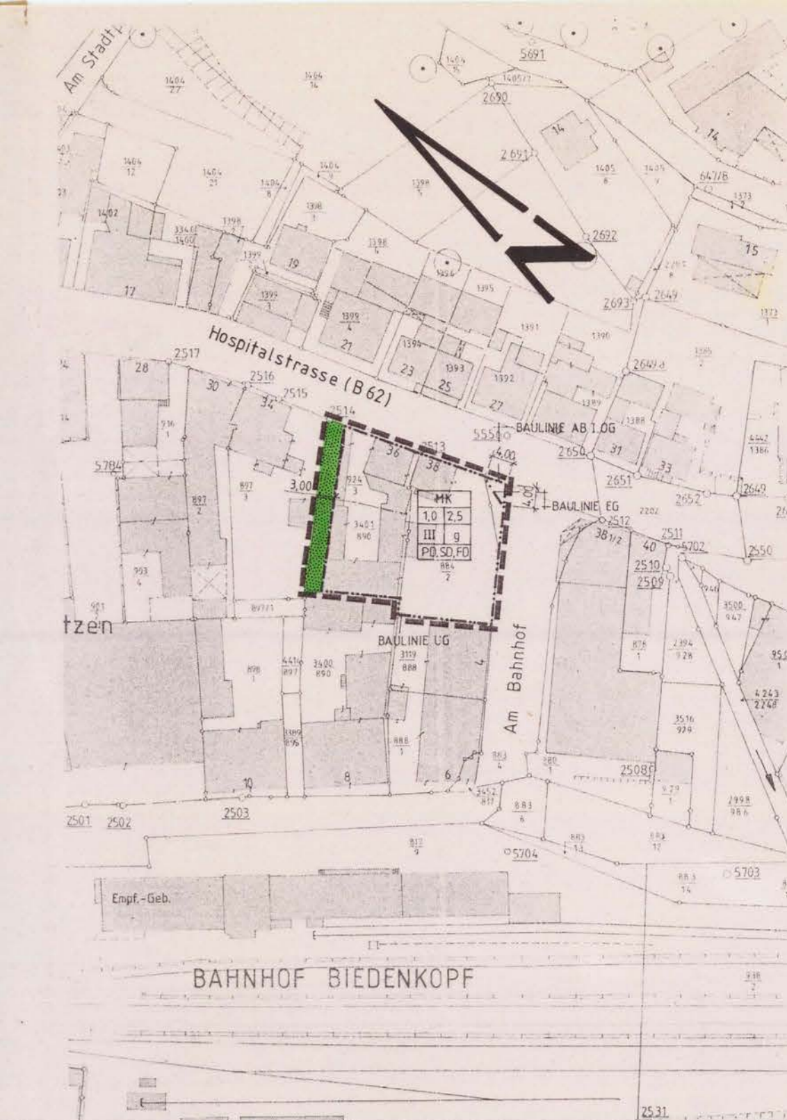
II. ÄNDERUNG ZUM BEBAUUNGSPLAN NR. 13 DER STADT BIEDENKOPF-KERNSTADT GEM § 13(1) BAUGB MAßSTAB: 1:1.000